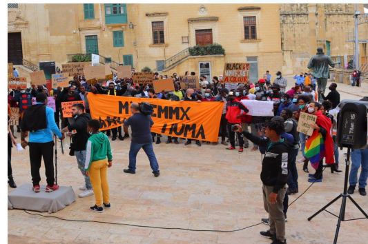
Αφρικανοί μετανάστες διαμαρτύρονται στην Βαλέτα, Μάλτα.