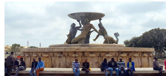
Μία περικυμμένη φωτογραφία που αγνοεί την τεράστια έκταση του Συντριβανιού των Τριτώνων στη Βαλέτα.